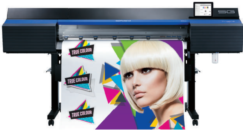
SG-540 (1.371 mm breit)