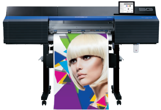
SG-300 (762 mm breit)