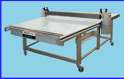
BOSS: Standard 305cm x 175cm