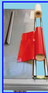
Doppel-Abroller für schnellen Rollenwechsel