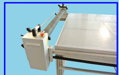
Abseitsparken des Walzenwages