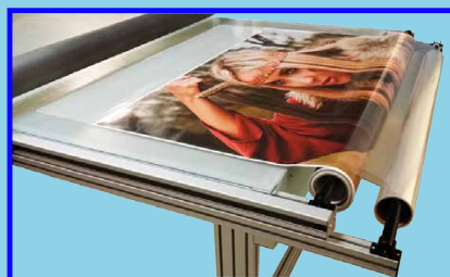
Extra, Halterung für Doppelrollen