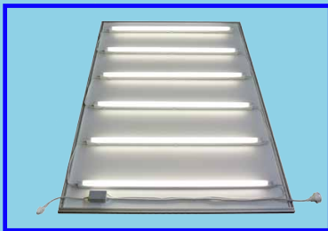
1m Lichtschublade mit Leuchtstoffröhren oder LED