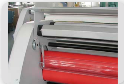
Einfacher Walzenzugang durch schwenkbaren Zuführtisch