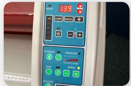
Mikroprozessorgesteuerte, einfachste Bedienung