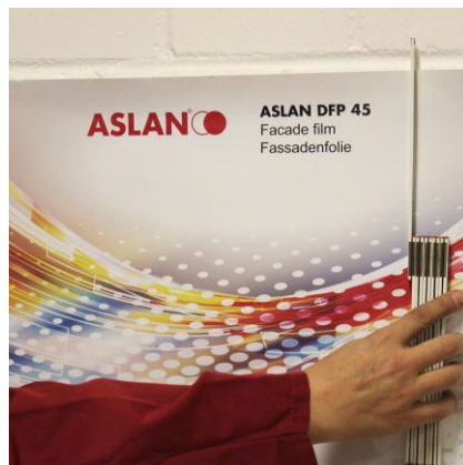
Ausrichten und fixieren

1. ASLAN DFP 45 ausschließlich für raue und feste Untergründe verwenden, der Untergrund muss staub-, fettfrei und trocken sein. Beschichtete Untergründe vorher auf deren Haftung prüfen.