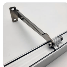
Halter 150 mm