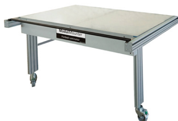
Erweiterungs-Modul erhältlich für beide Größen 1 Meter