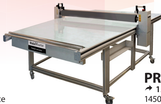
PROFI ↗ 1550 mm 1450 mm Breite 3050 mm Länge