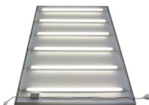
Lichtschublade erhältlich für beide Größen 1 Meter