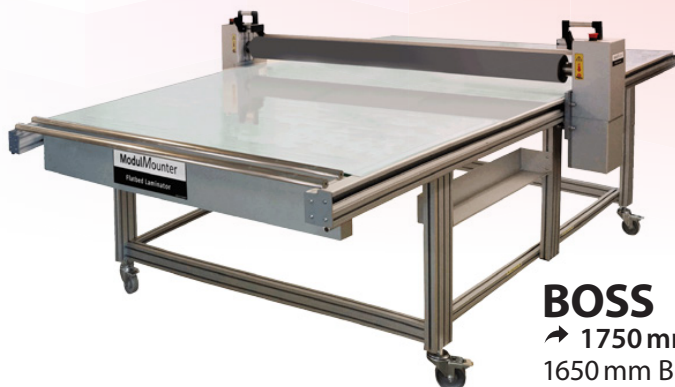
BOSS ↗ 1750 mm 1650 mm Breite 3050 mm Länge

NEU NEU NEU NEU NEU NEU NEU DER ELEKTRISCHE OHNE KOMPRESSOR