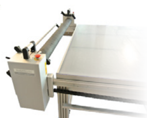
Parkplatz für den Walzwagen