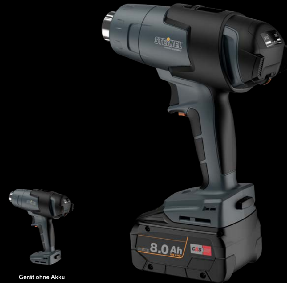
Gerät ohne Akku

Schnell zur Hand und zügig startklar: Das 18-V-Akku-Heißluftgebläse mobile heat MH 3 ist binnen fünf Sekunden einsatzbereit und bietet mit 300 °C und 500 °C zwei direkt am Joystick einstellbare Temperaturoptionen. Das kraftvolle Gerät ist für Luftmengen von bis zu 200 l/min ausgelegt. Mit einer Akkuladung können Sie bis zu 200 Schrumpfungen aller Art präzise und sicher durchführen. Dank integriertem LED-Licht ist der Arbeitsbereich immer optimal ausgeleuchtet.