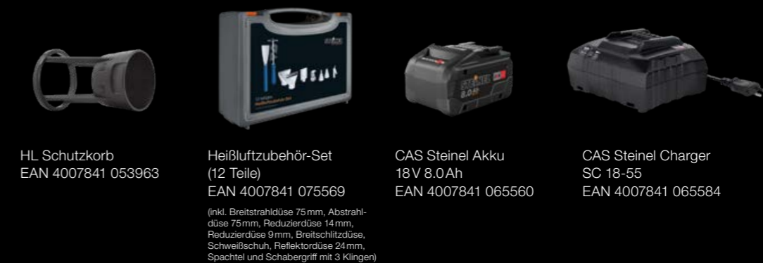
HL Schutzkorb EAN 4007841 053963