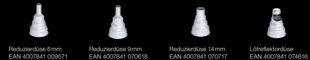
Reduzierdüse 6 mm EAN 4007841 009571