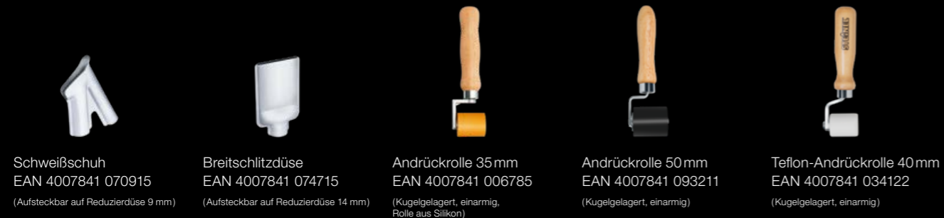
Schweißschuh EAN 4007841 070915 (Aufsteckbar auf Reduzierdüse 9 mm)