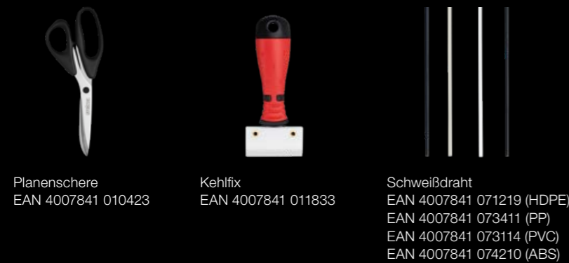
Planenschere EAN 4007841 010423