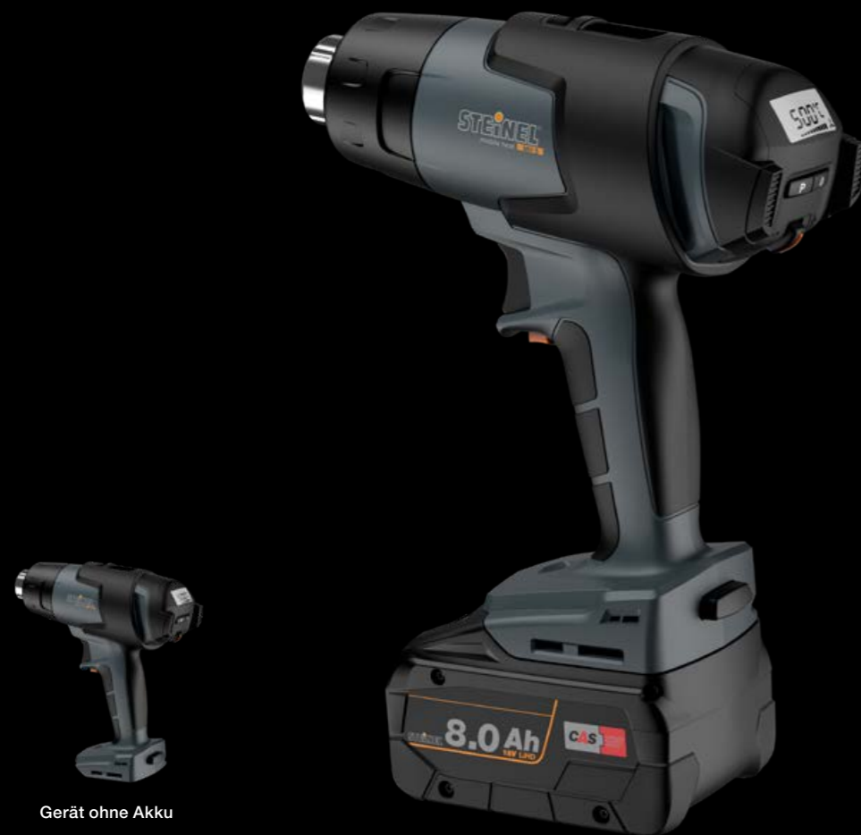
Gerät ohne Akku

Das kompakte mobile heat MH 5 bietet vier anwendungsspezifische Programme und liefert heiße Luft in Rekordzeit. Die Aufheizphase beträgt weniger als vier Sekunden. Bereits nach 20 Sekunden sind 500 °C erreicht. Die Temperatur kann zwischen 50 °C und 500 °C in 10 °C-Schritten bedarfsgerecht und punktgenau digital eingestellt werden. Zudem ist die Luftmenge in sechs Stufen digital regulierbar (bis 300 l/min). Über das Display behält man Temperatur und Luftmenge stets unter Kontrolle. Dank leistungsfähigem 18-V-CAS-Akku sind flexible, kabellose Einsätze möglich – ideal zum Beispiel für spontane Reparaturarbeiten an LKW-Planen oder zum schnellen Ausbessern von Dachbahnen.